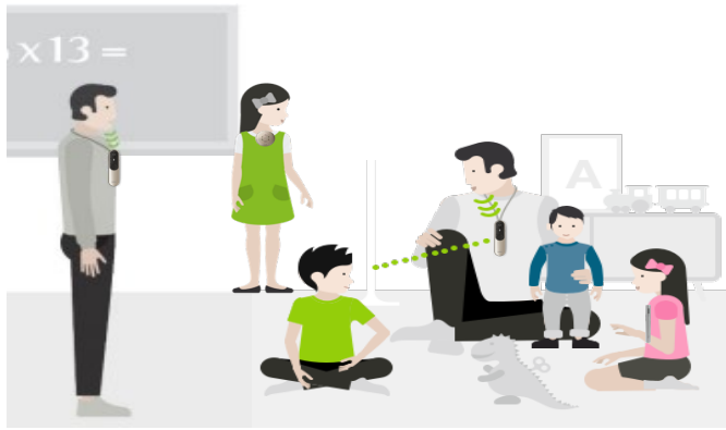
▲ 로저 멀티토커 네트워크 사용 중, 목걸이 모드 예시

: 한 번에 한 명의 목소리만 청취 가능하며, 동시에 말하는 경우 먼저 말을 시작한 화자의 목소리만 청취 가능합니다.